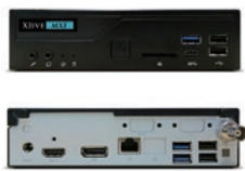
XJive MXF HD (FPV001)

「XJive MXF HD」は XDCAMの再生に対応、「XJive MXF UHD」は XDCAM 再生はもちろんXAVC Long GOP 200の再生にも対応した上位モデルです。