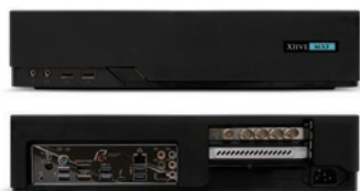
XJive MXF UHD (FPV002)